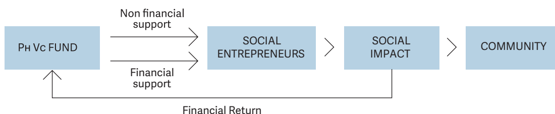
Figura 1 Schema di funzionamento della venture philanthropy (schema di Letts, Ryan e Grossman, 1997, adattato da Scarlata e Alemany, 2008).

L'EVPA (European Venture Philanthropy Association) definisce la venture philanthropy come un approccio integrato, coordinato e congiunto che opera al fine di costruire una rete più solida di organizzazioni che perseguono finalità sociali (EVPA, 2013; 2014; Balbo et al., 2016). Fulton, Kasper e Kibbe (2010) considerano la venture philanthropy un processo di adeguamento delle pratiche di gestione degli investimenti strategici al settore non profit, mirata a rafforzare organizzazioni in grado di generare elevati tassi di rendimento sociali sui loro investimenti.